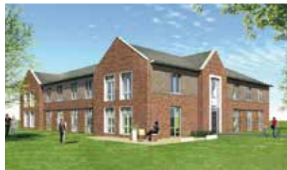
NIEUWE LOCATIES MET EIGEN GROTE TUIN