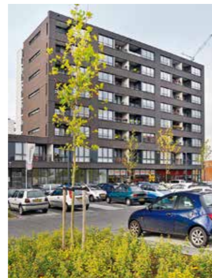
Houtweg 301-339 en 106-144, Emmen