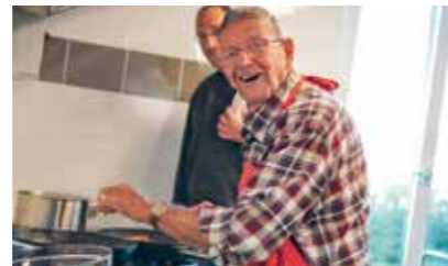
BEWONERS MOGEN HELPEN MET KOKEN