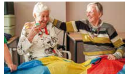
DAGELIJKS AFWISSELENDE ACTIVITEITEN